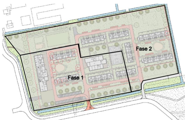
Afbeelding 3: bouwfaserig

Het plan wordt in twee fasen gerealiseerd. In de onderstaande afbeelding zijn de twee fasen weergegeven. Fase 1 loopt van mei 2019 tot mei 2020. Fase 2 loopt van mei 2020 tot mei 2021.