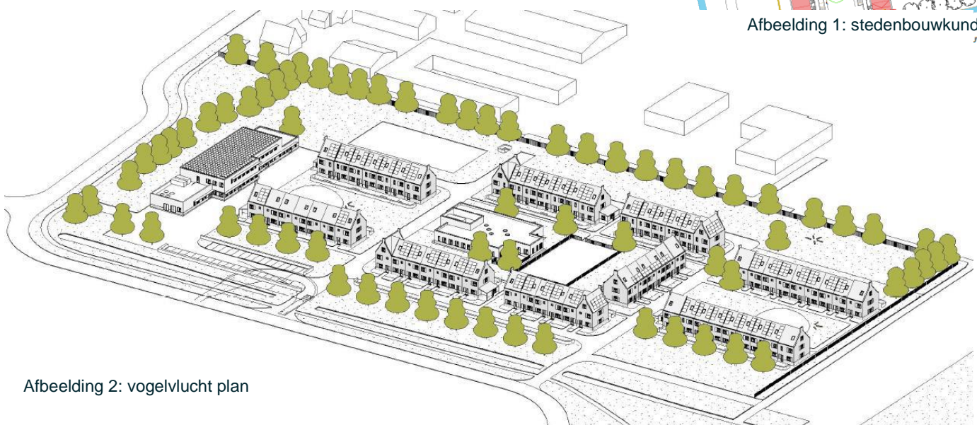
Afbeelding 2: vogelvlucht plan