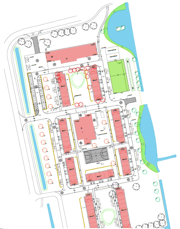
Afbeelding 1: stedenbouwkundig plan JWEN

Het COA en de gemeente hebben samen het stedenbouwkundig plan opgezet. Voor het ontwerp is de huidige stedenbouwkundige structuur als uitgangspunt genomen en blijven de entree en de parkeerplaats gehandhaafd. De nieuwe wijk voor het azc is opgezet met drie hofjes waar de woningen omheen staan. De hofjes zijn autovrij en voorzien van speelplekken voor kinderen. Tussen de woningen door zijn er steeds doorkijkjes, waardoor de wijk goed overzichtelijk is. Aan de binnenzijde van de hofjes is het levendig, aan de buitenzijde wat rustiger. Midden in de wijk ligt het activiteitengebouw en aan de meest noordelijke zijde het kantoorgebouw.