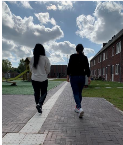
'Het is fijn om iemand te hebben die dezelfde taal spreekt'

De vriendinnen kunnen zich goed verstaanbaar maken in het Nederlands. 'Burgum is een goede plek', zegt mevrouw N. Haar vriendin knikt bevestigend. 'De kinderen hebben hier veel vrienden gemaakt en doen het goed.' Zo vertelt mevrouw N. dat haar zontje sinds kort naar de basisschool in het dorp kan. En haalt haar oudste dochter binnenkort zwemdiploma C. Mevrouw A. vertelt dat haar zontje voetbalt bij FC Burgum, zijn vader staat daar regelmatig aan de zijlijn de kinderen toe te juichen. Allebei zijn ze dit jaar verhuisd naar de nieuwe woningen op het centrum. Daar wonen ze samen met gezinnen die uit andere werelddelen komen, andere culturele gewoonten hebben en een andere taal spreken. Toch lijkt dit voor hen geen probleem te zijn. Op de vraag hoe zij dit doen, antwoorden ze dat je 'goede afspraken moet maken met elkaar'. Vooral als het op het schoonmaken én houden van de woning aankomt. Dat schoonmaken is iets dat mevrouw N. niet alleen thuis doet, maar ook op het centrum. Zij is verantwoordelijk voor de schoonmaak in het activiteitengebouw. Mevrouw A. ondersteunt elke week de vrijwilligers in de babyopvang op de locatie. Ook op vorige locaties hebben ze altijd met plezier gewerkt en geholpen bij activiteiten. Zij hopen u volgend jaar te ontmoeten bij de activiteiten van de open dag!