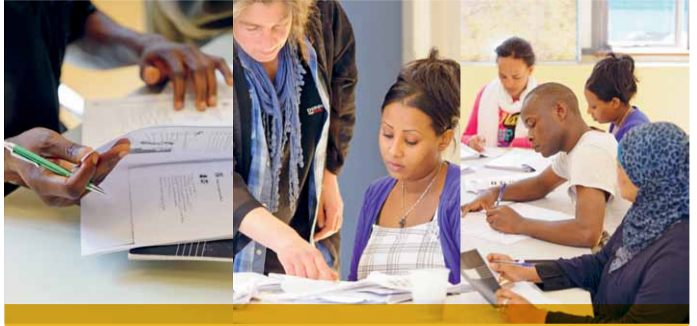
Vergunninghouders volgen Nederlandse les in azc Rotterdam.

Gemeenten blijken enthousiast over het voorinburgeringsprogramma dat het COA in opdracht van het ministerie van Binnenlandse Zaken en Koninkrijksrelaties biedt aan nieuwe vergunninghouders. Daarbij blijkt door gemeenten, zeker voor laagopgeleiden en analfabeten, naast het bereikte taalniveau als de opgedane leerervaring van de nieuwe gemeente-inwoners te worden gewaardeerd. Met het voorinburgeringsprogramma hebben nieuwe vergunninghouders hun eerste stappen gezet op weg naar inburgering.