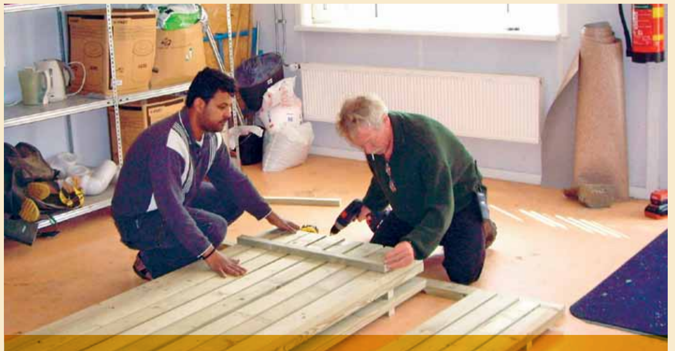
Samen picknicktafels maken.

Het was een leuke manier om rechtstreeks in contact te komen met een toch onbekend deel van de maatschappij, daar is iedereen het over eens. “Ik fiets hier altijd langs, maar wist nooit hoe het er aan toe gaat”, zei een deelnemer. Büscher: “De conclusie was: het leven verloopt in een azc niet anders dan anders, de situatie waarin mensen zich bevinden is wel bijzonder.”