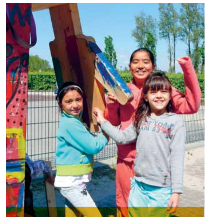
Kinderen in azc Katwijk tijdens een activiteit van Stichting de Vrolijkheid.

Om meer activiteiten voor kinderen te kunnen organiseren, werkt het COA met derde partijen. Zo wordt landelijk met Stichting de Vrolijkheid, de Guusje Nederhorst Foundation en de ANWB samengewerkt. "Maar ook lokaal valt veel te winnen", stelt Weert. "We ontwikkelen momenteel met ervaren netwerkpersoneel een handboek met tips voor locatiemanagers om de lokale netwerken effectiever aan te spreken. Hoe ga je bijvoorbeeld in gesprek met het buurthuis of de Rotary? Je zult als je een geld-