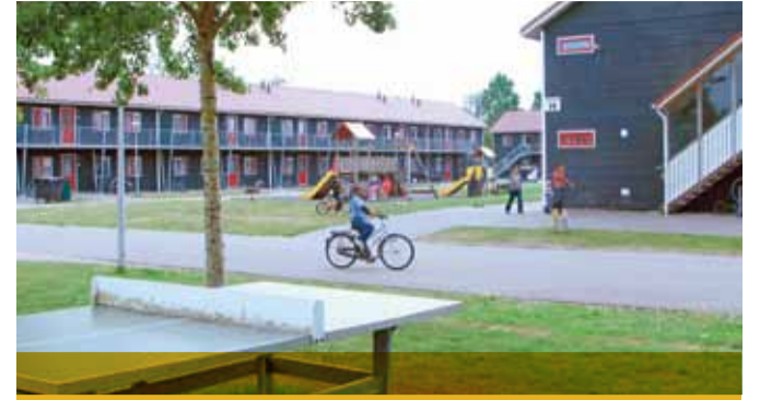
Bewoners van azc Burgum genieten van de buitenlucht.

Azc Burgum heeft ook bewoners die meteen na afloop van de algemene asielpcedure een negatieve beschikking hebben gekregen. Zij hebben nog 28 dagen recht op opvang en moeten daarna weg. "Een lastige boodschap, die het team menselijk – met begrip voor de teleurstelling – maar tegelijkertijd duidelijk brengt" vertelt Kunnen. "We stimuleren deze