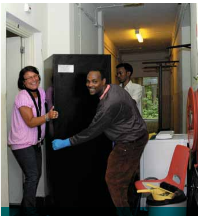
Bewoners en medewerkers helpen mee met de voorbereidingen op de pol in Gilze en Rijen.

We kijken tegelijkertijd vooruit. De omgeving van het COA is dynamisch. We zijn gewend aan het omgaan met veranderingen, die dat met zich meebrengt. Ook in de toekomst zetten we onze schouder eronder en zullen we, samen, weer zoeken naar werkbare oplossingen.