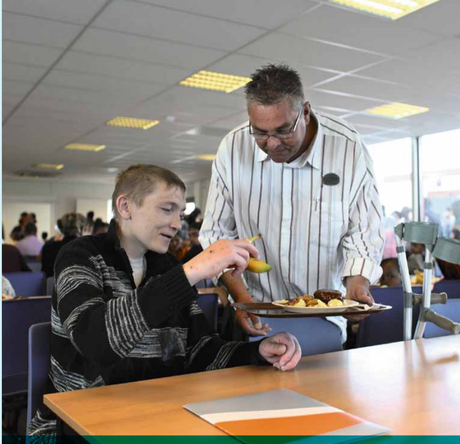
Woonbegeleider in Ter Apel. De tijdelijke noodvoorziening maakt plaats voor de col en pol.

De amv verblijft op de pol-amv gedurende de rust- en voorbereidingstermijn (rvt), de AA-procedure en de indicatieperiode. De indicatieperiode is nodig om te bepalen welke vervolgoopvang noodzakelijk is,