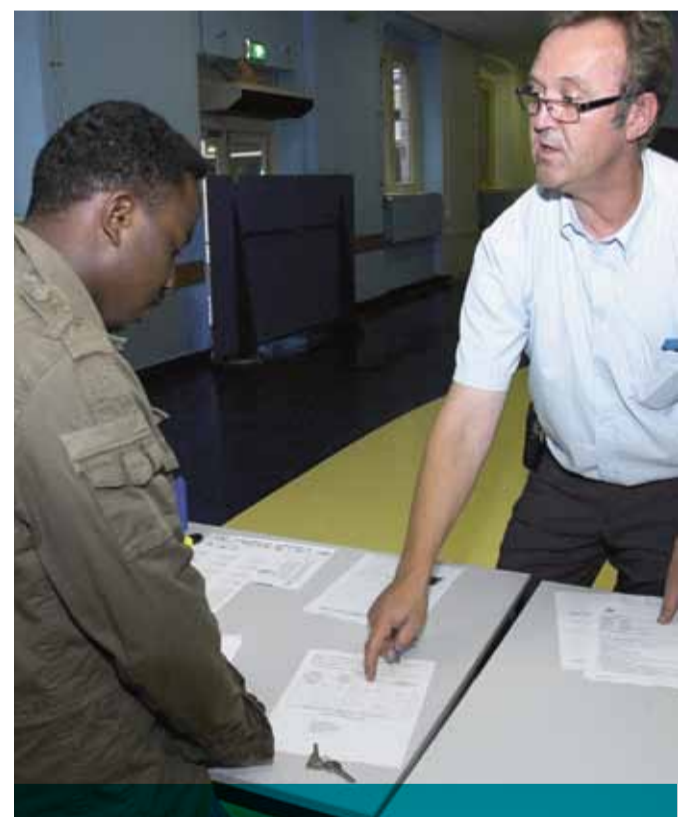
Een woonbegeleider geeft de intake aan een nieuwe bewoner in de pol in Gilze en Rijen.