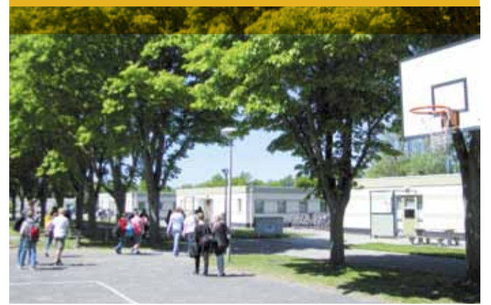
Scholieren krijgen een rondleiding op azc Den Helder.