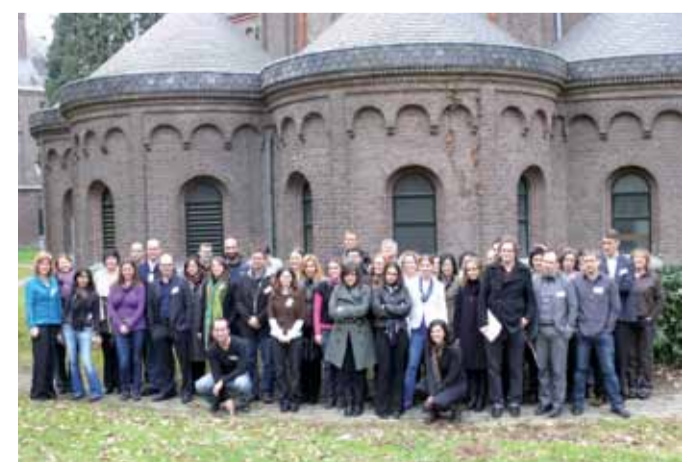
Deelnemers van het project RET.

Eind oktober vindt opnieuw een seminar plaats en in 2011 komen alle onderwerpen een tweede keer aan bod. Désirée Horbach legt uit dat deelnemende landen die thema's bijwonen die voor hen interessant zijn: "Een land met een zeer hoge instroom van asielzoekers, zoals Cyprus, kampt met een andere problematiek dan bijvoorbeeld Letland, dat een lage instroom heeft. De meeste landen nemen wel aan alle seminars deel, maar komen soms wel met verschillende medewerkers." Eind 2011 wordt de eindconferentie georganiseerd, waar de resultaten zullen worden gepresenteerd. Projectleider Désirée Horbach is overtuigd van het succes van RET: "De Europese commissie stimuleert de samenwerking van de lidstaten op het gebied van asielopvang en het COA draagt daar graag aan bij. In de dagelijkse praktijk is geen tijd om dieper op deze onderwerpen in te gaan, dit project biedt daar de gelegenheid voor."