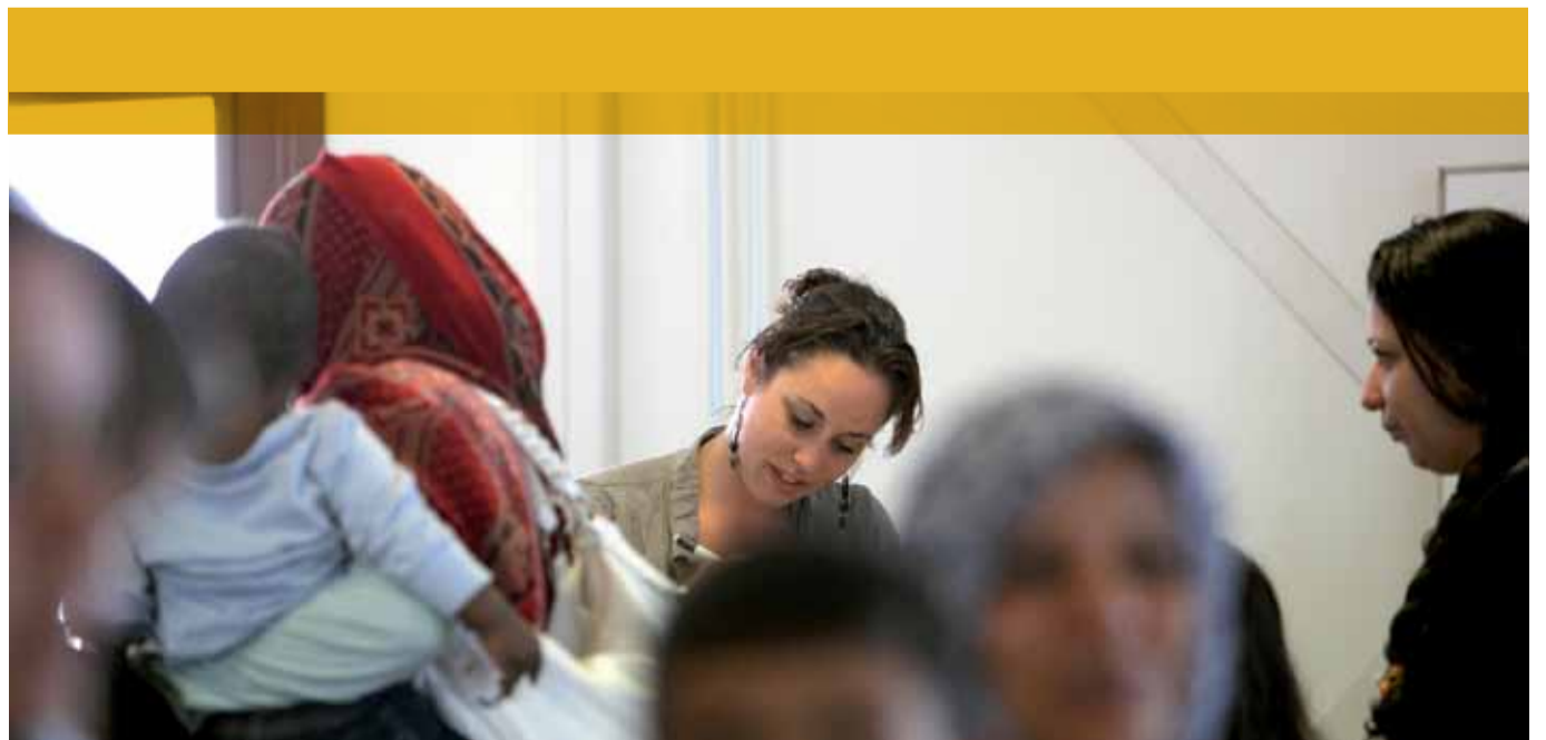
Per 1 juli is de nieuwe asielprocedure ingevoerd. Nadat de plannen hiervoor gezamenlijk op ketenniveau zijn gemaakt, hebben alle partners in hun eigen organisatie gewerkt aan de nieuwe invulling van de afgesproken rol. Ook het COA heeft, waar nodig, processen aangepast en vernieuwde werkwijzen ingevoerd. Want opvangen is en blijft ons werk.

De 'national officer' van de UNHCR volgt de ontwikkelingen in Nederland op gebied van vluchtelingenbeleid en rapporteert hierover aan het regionaal UNHCR-kantoor voor West Europa in Brussel. Ook werkt hij aan individuele vluchtelingenzaken, publieke bewustwording en de verspreiding van de UNHCR-standpunten in de politiek.